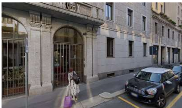
Milano –Via Conservatorio, 15 20122 Tel +39 02 92854246