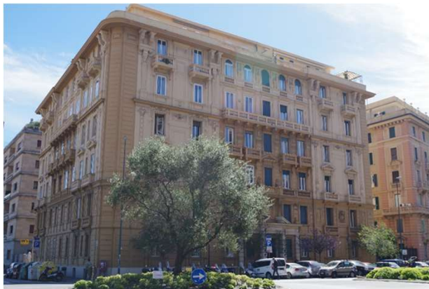
Genova –Piazza G. Alessi 2/7, 16128 Tel +39 010 8183250