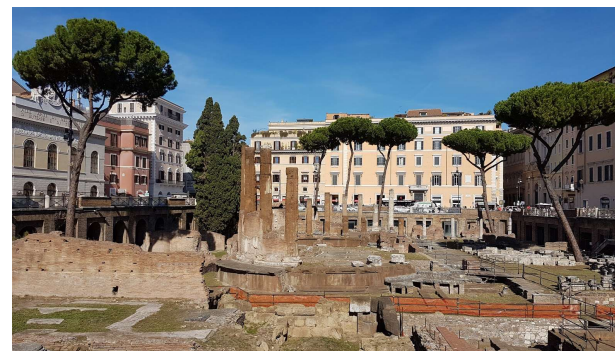
Roma –Largo Torre Argentina, 11 00186 Tel +39 06 86358612